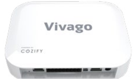
Vivago Viva POINT

Saatavana kuusi eri laitteistokokoonpanoa joustavaa asennusta varten