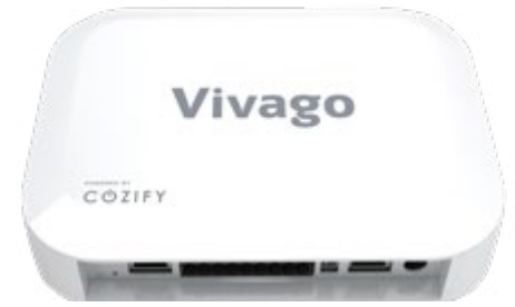
Vivago Room POINT

Relieliitin langallisen hälytyslaitteen liittämistä varten