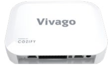
Vivago Domi POINT