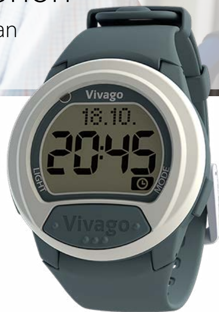
Säännöllinen, hyvä vuorokausirytmii

Hyvinvoinnin seuranta on johtanut myös kipulääkkeen tarpeen arviointiin uudelleen. Järjestelmän avulla havaittiin, että asiakas ei nukkunut hyvin öisin, ja sen seurauksena oli passiivinen sekä unelias päiväsaikaan. Lääkityksen korjaaminen johti säännöllisempään vuorokausirytmiiin, parempiin uniin ja kasvavaan aktiivisuuteen sekä toimintakykyyn.