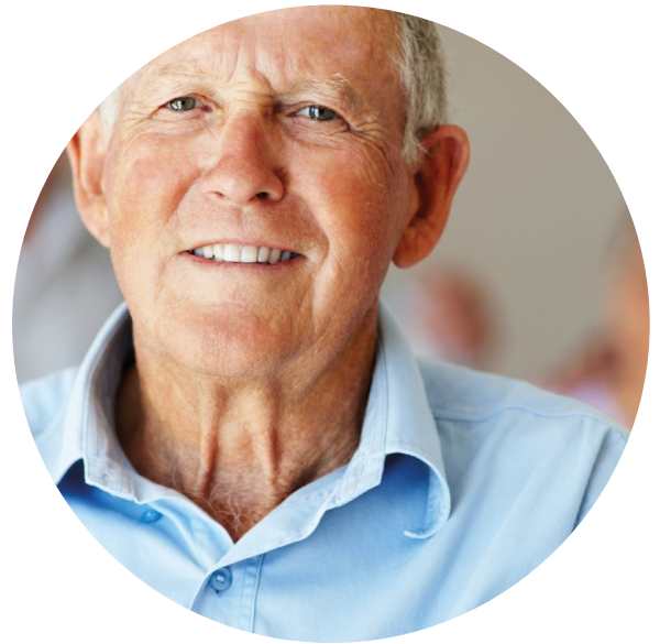
Asiakkaan nimi on muutettu ja kuvan henkilö ei liity tapaukseen.